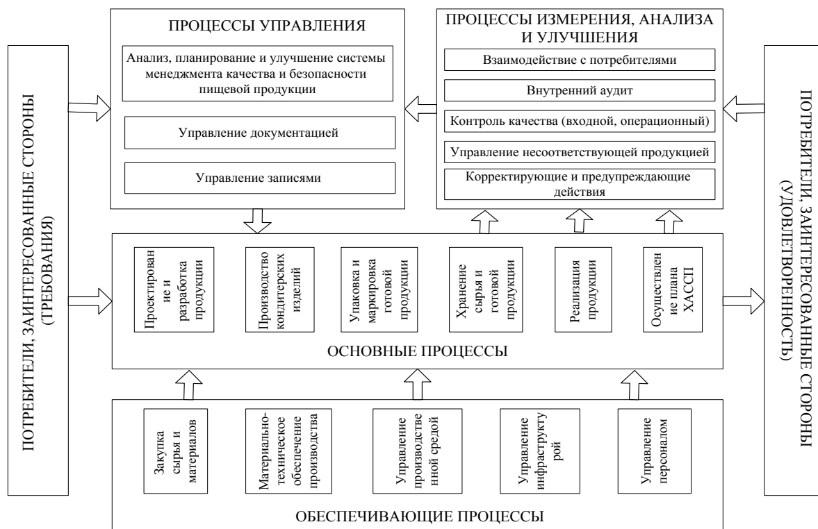
Рис. 1. Процессная модель кондитерского предприятия

На первом этапе проведена идентификация ключевых процессов предприятия. По результатам данного этапа составлена процессная модель с учетом разрабатываемых систем (рис. 1).