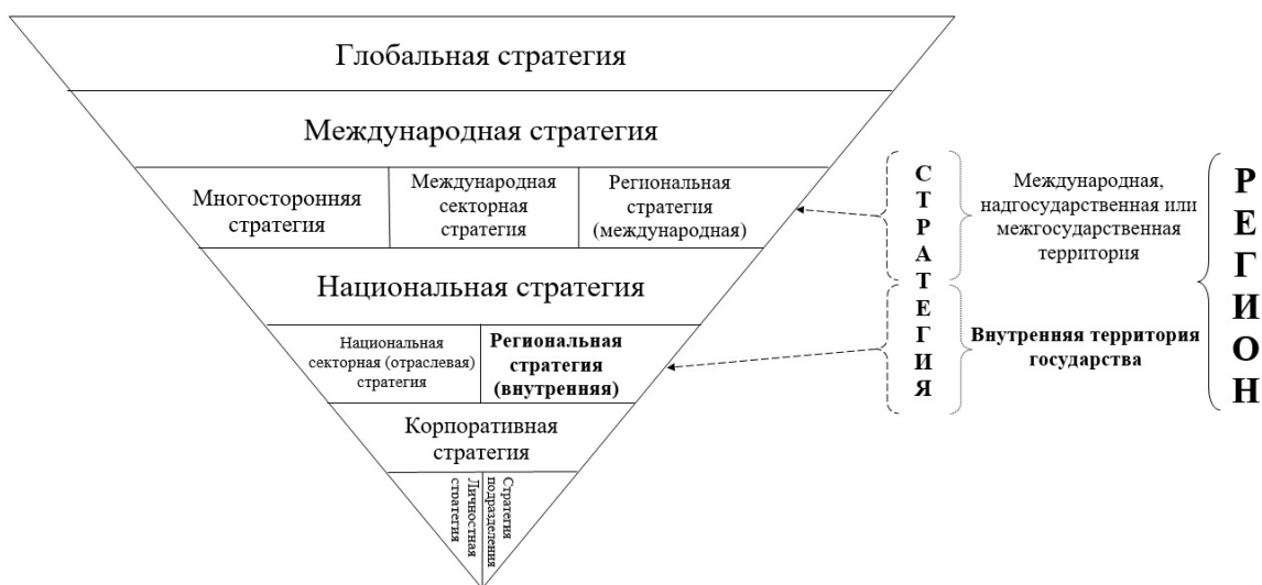
Рис. 1. Подходы к содержанию дефиниции «регион» в концептуальной схеме целостной национальной стратегии